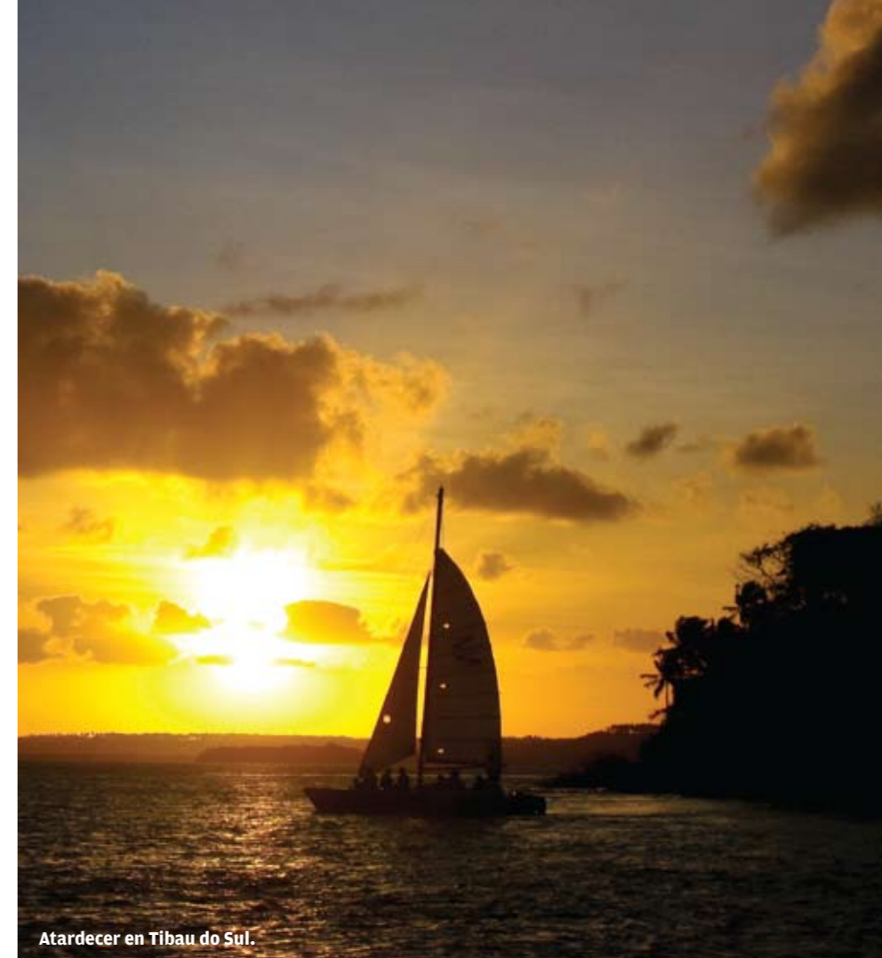
Atardecer en Tibau do Sul.

Por el mar o caminando se puede llegar a la Baía dos Golfinhos, el hogar de los mamíferos tipo Flipper de la playa do Madero. Una enorme escalera de más de 200 peldaños une la playa con la