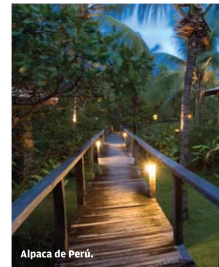
Alpaca de Perú.

Entonces, ¿qué hermana a Pipa y Jericoacoara? Las ganas irremediables de querer más T