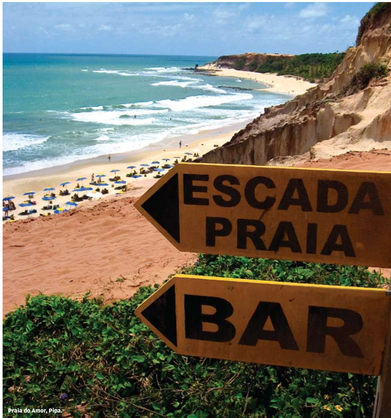
Praia do Amor, Pipa.

PIPA Y JERICOACOARA SON DOS PLAYAS DEL NORESTE DE BRASIL QUE SUELEN INTEGRAR, UNA Y OTRA VEZ, EL RANKING DE LAS MEJORES DEL MUNDO. PERO, ¿CUÁL ES EL HECHIZO QUE EJERCEN SUS PUESTAS DE SOL, EL MAR Y LAS DUNAS SOBRE MILES DE VIAJEROS QUE SUEÑAN, AÑO TRAS AÑO, CON QUEDARSE A VIVIR AQUÍ?