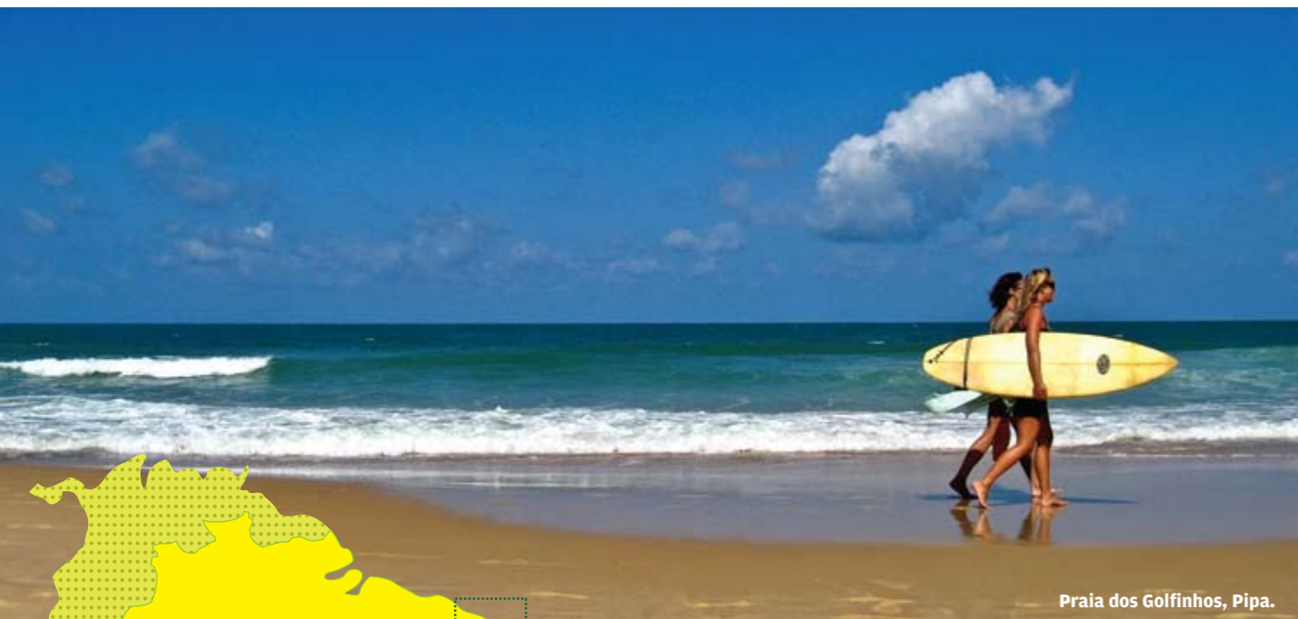
Praia dos Golfinhos, Pipa.