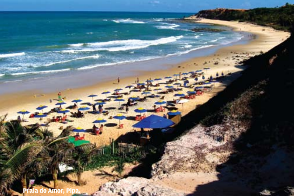
Praia do Amor, Pipa.